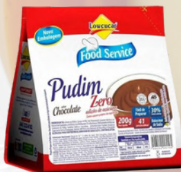
3029 PUDIM LOWÇUCAR CHOCOLATE FOOD SERVICE 200G