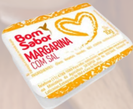
3440 MARGARINA BLISTER BOM SABOR COM SAL 144X10G