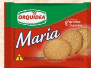
3893 BISCOITO MARIA SACHE ORQUIDEA 9,6GRS C/200UN.