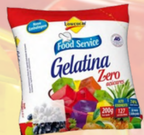
3015 GELATINA LOWÇUCAR LIGHT MARACUJA 200GR