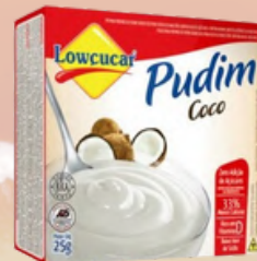
3523 PO P/PREP PUDIM COCO CARTUCHO 25G