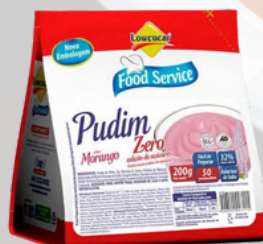
3032 PUDIM LOWÇUCAR MORANGO FOOD SERVICE 200G