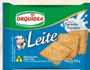
3823 BISCOITO LEITE SACHE ORQUIDEA 9,6GRS C/200UN.