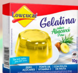
3528 GELATINA CARTUCHO LOWÇUCAR ABACAXI 10GR