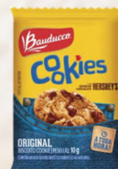
8207 COOKIES ORIGINAL BAUDUCCO CX C/450UN 10GR