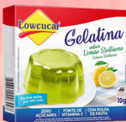
3532 GELATINA CARTUCHO LOWÇUCAR LIMAO SICILIANO 10GR