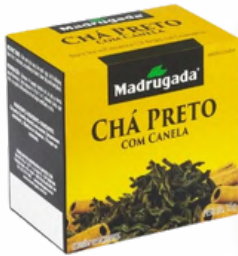
6459 CHA PRETO COM CANELA MADRUGADA 10/1,5GR