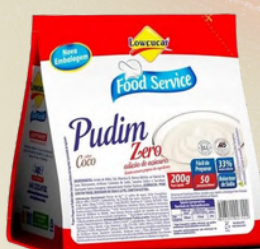
3030 PUDIM LOWÇUCAR COCO FOOD SERVICE 200G