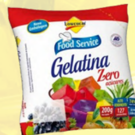
3017 GELATINA LOWÇUCAR LIGHT MORANGO 200GR