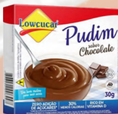
3522 PO P/PREP PUDIM CHOCOLATE CARTUCHO 30G