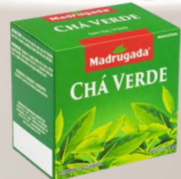
3267 CHA VERDE MADRUGADA 10/1,5GR