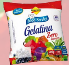
3018 GELATINA LOWÇUCAR LIGHT CEREJA 200GR