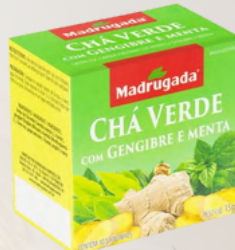
6411 CHA VERDE C/ GENGIBRE E MENTA MADRUGADA 10/15GR