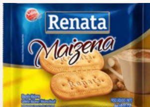
3055 BISCOITO MAISENA RENATA C/180UN.