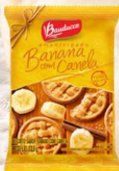
3068 BISCOITO BANANA C/ CANELA BAUDUCCO 2X2 400X13,1G