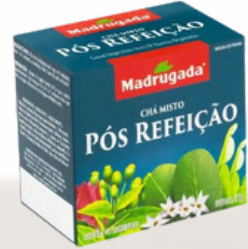
6358 CHA POS REFEICAO MADRUGADA 10/1,5GR