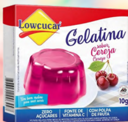
3527 GELATINA CARTUCHO LOWÇUCAR CEREJA 10GR