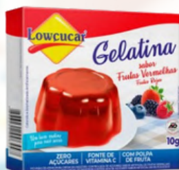
3531 GELATINA CARTUCHO LOWÇUCAR FRUTAS VERMELHAS 10GR