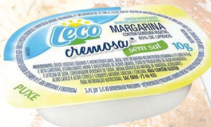
3044 MARGARINA LECO CREMOSA S/SAL 192X10G - 1528