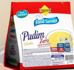
3028 PUDIM LOWÇUCAR BAUNILHA FOOD SERVICE 200G