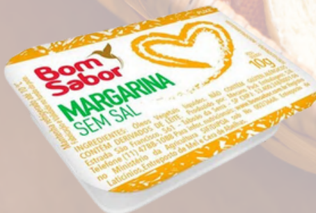
3441 MARGARINA BLISTER BOM SABOR SEM SAL 144X10G