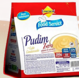
3031 PUDIM LOWÇUCAR LEITE CONDENSADO FOOD SERVICE 200G