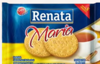
3054 BISCOITO MARIA 2X2 RENATA 11GRS C/180UN.