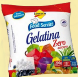
3021 GELATINA LOWÇUCAR LIGHT FRAMBOESA 200GR