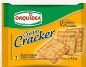
3822 BISCOITO CREAM CRACKER SACHE ORQUIDEA 9,6GRS C/200UN.