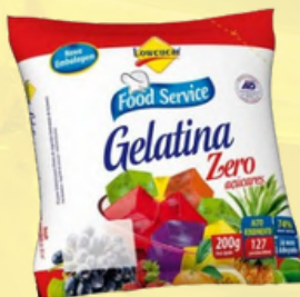
3016 GELATINA LOWÇUCAR LIGHT LIMAO 200GR