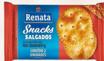
3950 BISCOITO SNACKS 2X2 RENATA 5GRS C/280UN.