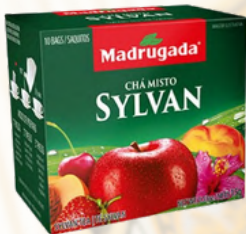
3275 CHA SYLVAN MADRUGADA 10/1,5GR