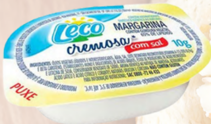
3043 MARGARINA LECO CREMOSA C/SAL 192X10G - 769198