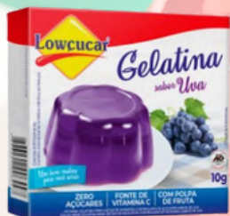
7774 GELATINA CARTUCHO LOWÇUCAR UVA 10GR