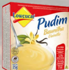
3526 PO P/PREP PUDIM BAUNILHA CARTUCHO 25G