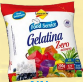
3406 GELATINA LOWÇUCAR LIGHT TANGERINA 200GR