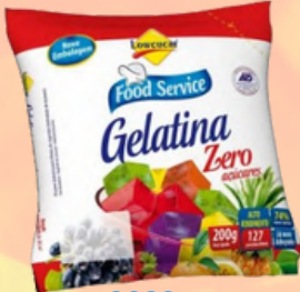
3020 GELATINA LOWÇUCAR LIGHT UVA 200GR