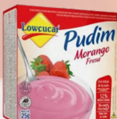
3524 PO P/PREP PUDIM MORANGO CARTUCHO 25G