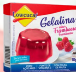
3530 GELATINA CARTUCHO LOWÇUCAR FRAMBOESA 10GR