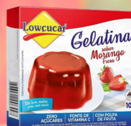
3533 GELATINA CARTUCHO LOWÇUCAR MORANGO 10GR