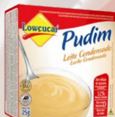
3525 PO P/PREP PUDIM LEITE CONDENSADO CARTUCHO 25G