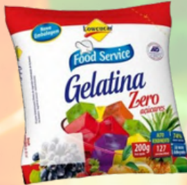
3019 GELATINA LOWÇUCAR LIGHT ABACAXI 200GR