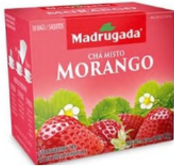
3319 CHA MORANGO MADRUGADA 10/1,5GR