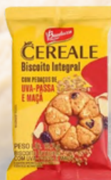
7879 BISCOITO CEREALE MACA E UVA BAUDUCCO 2X2 380X12,7G