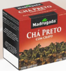
3272 CHA PRETO CRAVO MADRUGADA 10/1,5GR