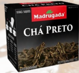
3269 CHA PRETO MADRUGADA 10/1,5GR