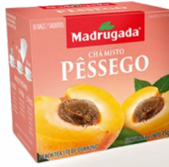
3320 CHA PESSEGO MADRUGADA 10/1,5GR